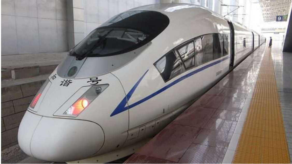
जापानी बुलेट ट्रेन | प्रतीकात्मक तस्वीर