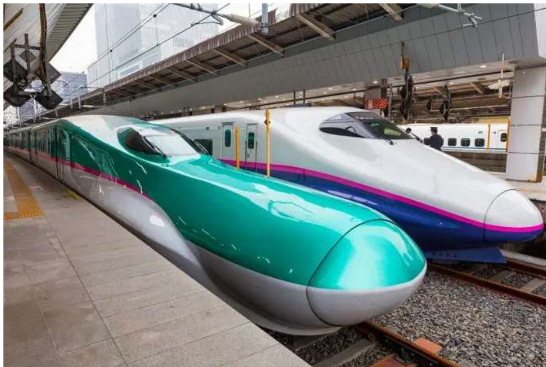
Mumbai-Ahmedabad Bullet Train Project

AHMEDABAD (Metro Rail News): Big industry players, including Larsen & Toubro (L&T) , Tata Projects , JMC Projects and NCC have evinced interest in the Mumbai-Ahmedabad bullet train project . As technical bids for the design and construction of 237 kilometres in the Mumbai-Ahmedabad corridor was opened on Wednesday, a total of three bids were submitted — by L&T and two separate consortia of companies.