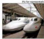
The bidders for the 237-km stretch of the mainline are all Indian companies

Officials said the 237km corridor will cross 24 rivers and 30 road crossings. "This entire section