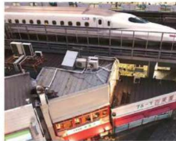
The National High-Speed Rail Corporation, which is responsible for executing the Mumbai-Ahmedabad high-speed project, said it will alone create more than 90,000 direct and indirect jobs during the construction phase

The National High-Speed Rail Corporation (NHSRCL), which is responsible for executing the Mumbai-Ahmedabad high-speed project, said it will alone create more than 90,000 direct and indirect jobs during the construction phase. Not just the employment market but even the manufacturing sector is expected to gain from