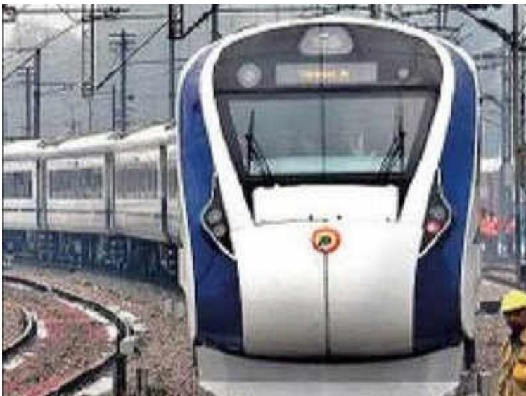
Bullet train tender opens, all seven bidders are Indian

NEW DELHI: The National High Speed Rail Corporation (NHSRCL) on Wednesday opened the bids for first tender entailing investment of around Rs 20,000 crore for construction work for the Ahmedabad-Mumbai bullet train project. All the bidders for this 237 km length of the mainline falling in Gujarat are Indian companies.